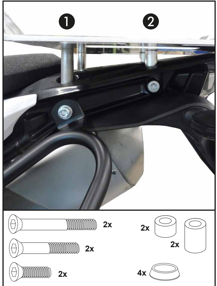
Abbildung zeigt: Adventure R Picture shows: Adventure R

The mounting is done in the now free threaded holes with countersunk screws M8x40 and countersunk washers M8. Place the aluminium spacers \varnothing 15 \times \varnothing 9 \times 20 between the enlargement and the original rack.